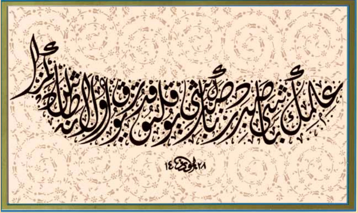
Resim: Ebuzer ÖZKAN Tezhipçi: Ayten AKSU