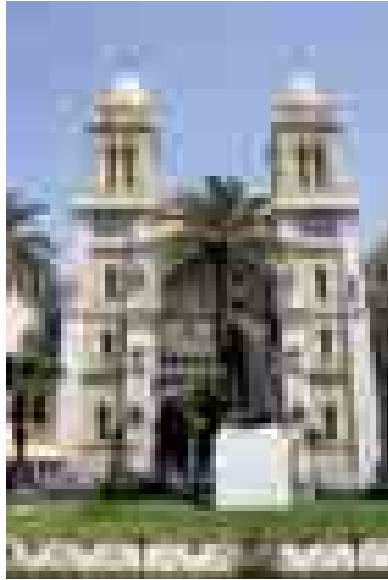
© Katedralin önünde İbn Haldûn Heykeli

nettiğim bir yapı gördüm. Yine dar olan yoldan revaklı küçük bir avluya girdim. Yapının kapısının sol yanındaki kitabe, burasının (X. yüzyılın ilk yarısında Tunus'ta yaşamış olan önemli bir şahsiyet) Sîdî Muh-