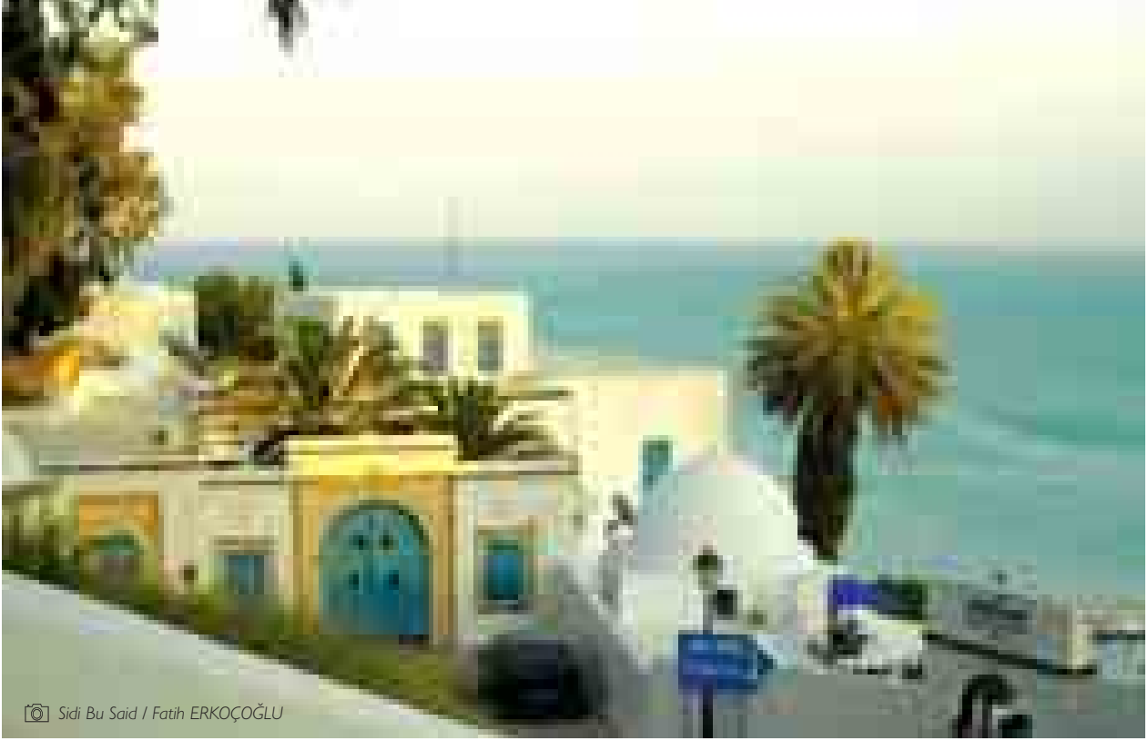
© Sidi Bu Said / Fatih ERKOÇOĞLU