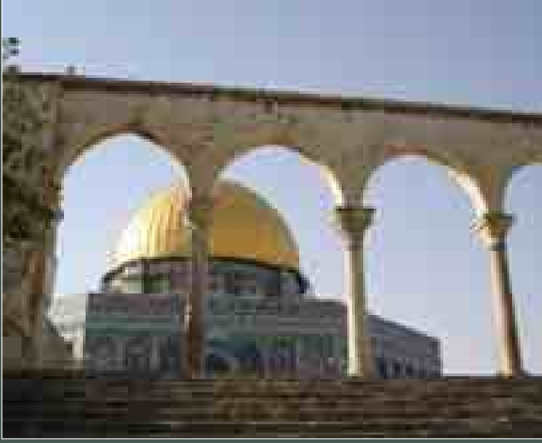
Mescid-i Aksa - Kudüs

mana da Batı'nın medenî de-ğil, barbar tarafları olarak 1.ve 2. Cihan Savaşları gösterildi. Özellikle Fransız aydınlar buna baş kaldırdılar. Ve antropoloji alanında pek çok çalışmalar yapıldı. Bu netice itibarıyla yer yüzünde tek kültürün olmadığı, tek değerli kültürün olmadığı, bütün kültürlerin kendi içinde değerli olduğu varsayımı kabul edildi. Bunun arkasında da medeniyetin tek bir Batı Medeniyeti olmadığı farklı medeniyetler bulunduğu ve bu medeniyetlerin zaman içerisinde evrensel medeniyete katkıda bulunduğu görüşü benimsendi. Fakat bu nasıl örosantizm bir hata idi ise özellikle Sovyetler bloğunun dağılmasından sonra Batı'da yeni bir anlayış gelişti. Ve bu anlayışa göre de medeniyetler çatışması teorisi dediğimiz teori sanki genel geçer doğruymuş gibi kabul edildi ve etrafa yansısı.