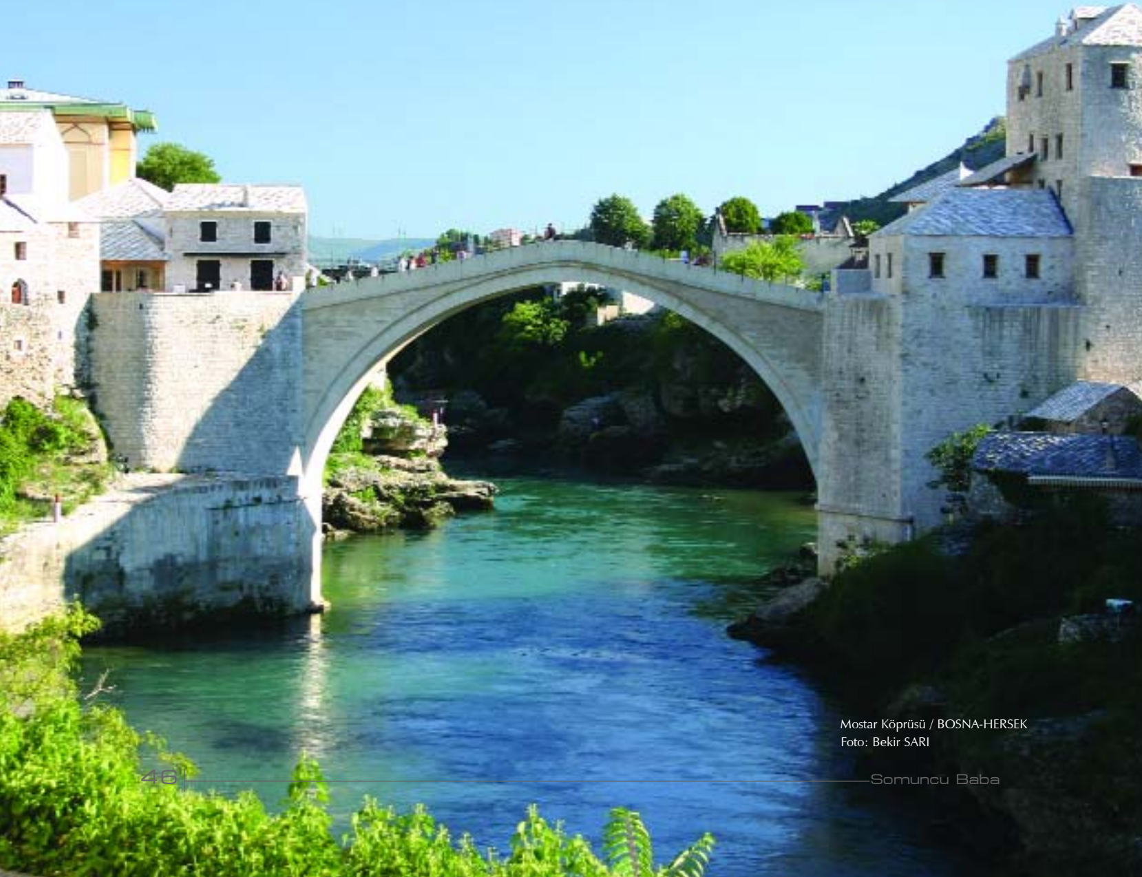
Mostar Köprüsü / BOSNA-HERSEK

Suya gömülen Mostar bütün bunları da düşe bıraktı. Şimdi düş gerçek olur mu olmaz mı? Her şey zamana kaldı.