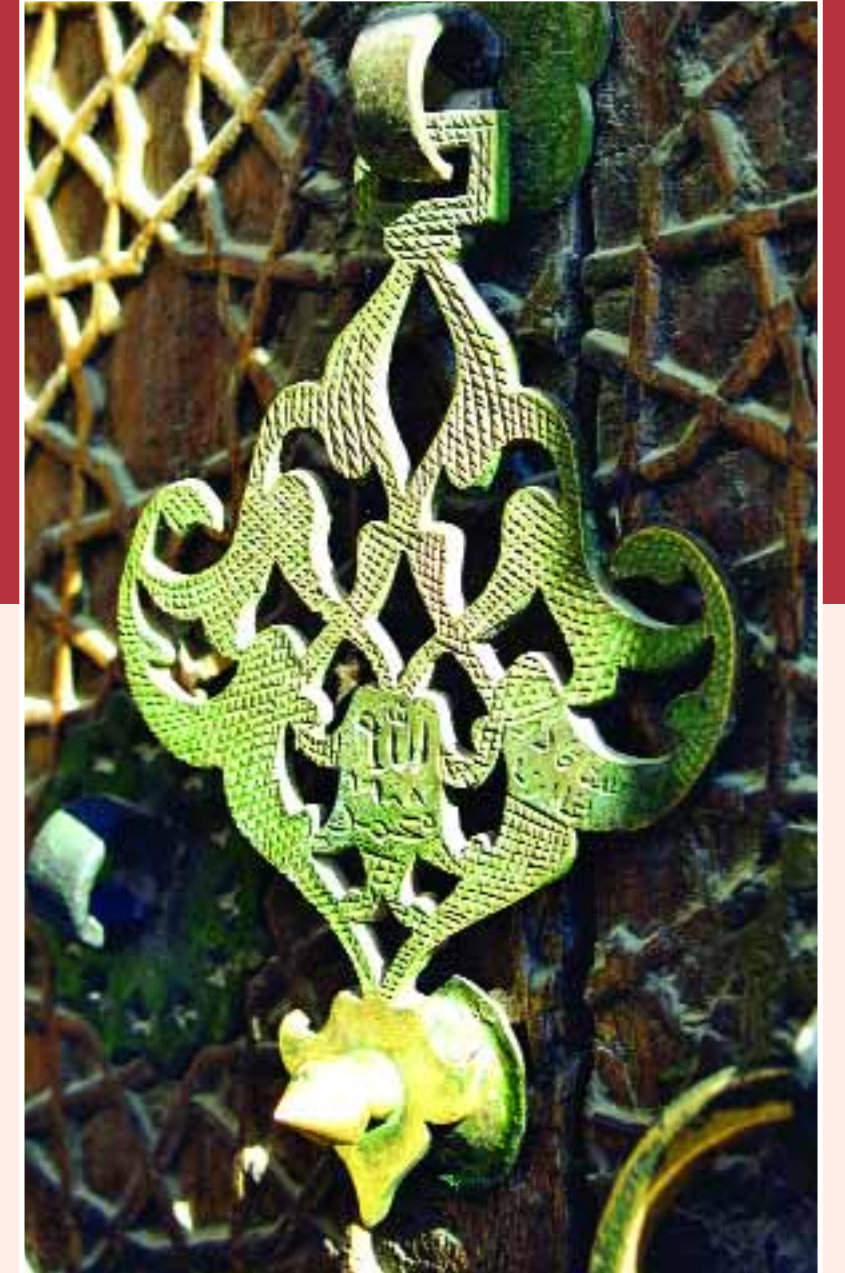
Şah-ı Nakşibendi Dergahının Kapı Tokmağı - BUHARA

Bursa Ulu Cami'de bir Cuma vazısı sırasında, kürsüde bulunan İranlı bir vaiz'in, gönderilen tüm peygamberlerin aynı derecede olduğunu söylemesi üzerine, cemaatten bazıları karşı çıkmış, bunun üzerine camide bir kargaşa yaşanmıştır. Bu tartışmalar sırasında camide bulunan Süleyman Çelebi, durumdan çok etkilenmiş ve mevlidi kaleme almıştır. Bu mevlidin çok beğenilmesi ve çeşitli dînî tören-